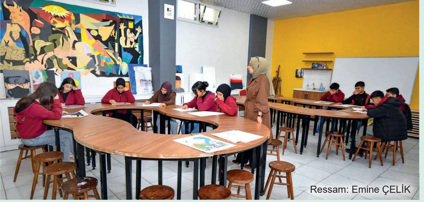
Ressam: Emine ÇELİK

Sanat eğitimi bireyin, sosyal, bedensel ve ruhsal gelişimine sağladığı katkıdan dolayı oldukça büyük bir öneme sahiptir ve genel eğitim sistemi içinde çocuğun yaratıcılığını en rahat ifade edebildiği yer, sanat eğitimi alanıdır. Öğrencilerin coşkulu, hareketli ruhsal yapısı ve duygusal dünyasının dışa açık olmasından dolayı alıcılarının en açık olduğu çağ olan eğitimin ilk yıllarında oldukça önemlidir. Fakat ne yazık ki, özel okullar dışında öğrencilerin görsel sanatlar öğretmenleri ile tanışabildikleri en erken dönem 11 yaş düzeyinde (5. Sınıf) olmaktadır. Görsel sanatlar eğitimi, öğrencilerin yaşantılarından elde ettikleri bilgilerle, derslerinde öğrendikleri konular arasında daha iyi sentezleme yapabilmesine, gözlem yeteneğinin ve el becerilerinin büyük oranda gelişmesine aynı zamanda da pratik zekâsının ivme kazanmasına oldukça katkı sağlar. Farabi Anadolu Lisesi olarak her yıl görsel ve sanatlar bölümünde üniversiteye hazırlık için çalışmalar yapılmaktadır.